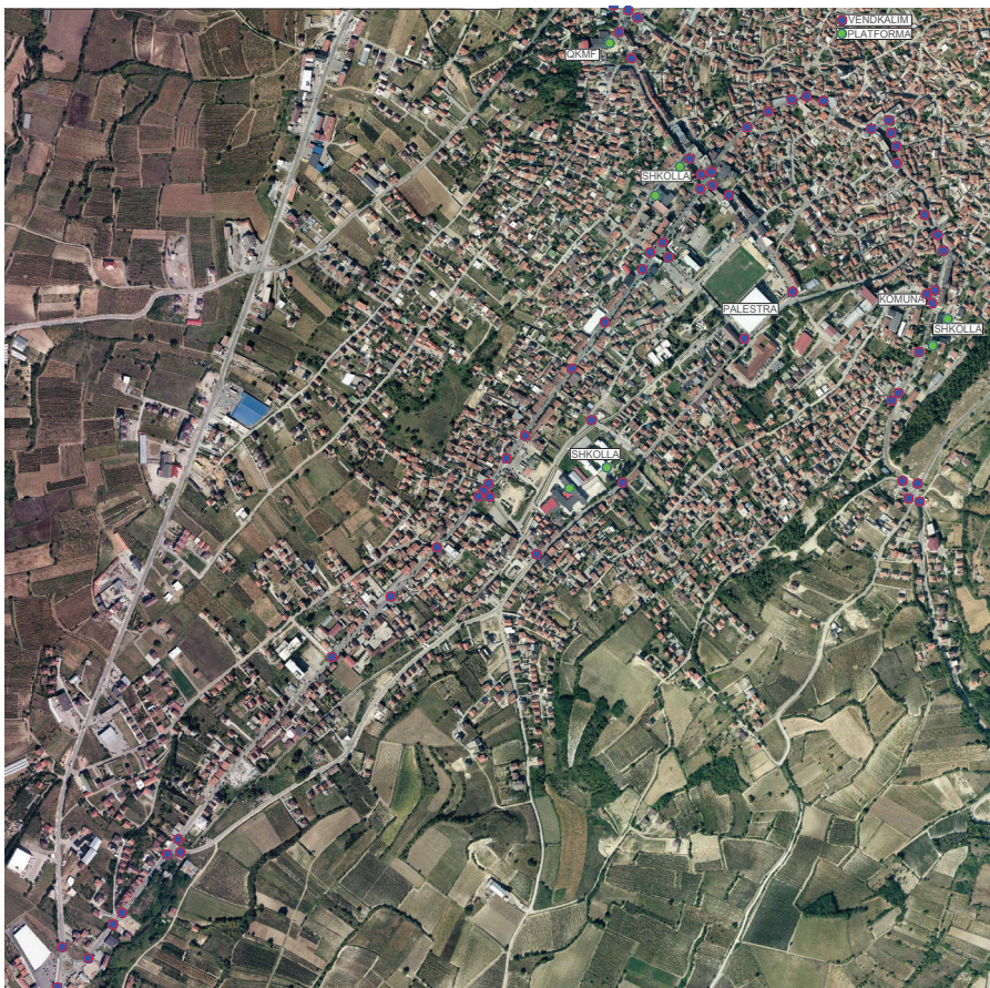
Slika 1. Mapa sa infrastrukturnim investicijama za pristup osobama sa posebnim potrebama u gradu Orahovcu.