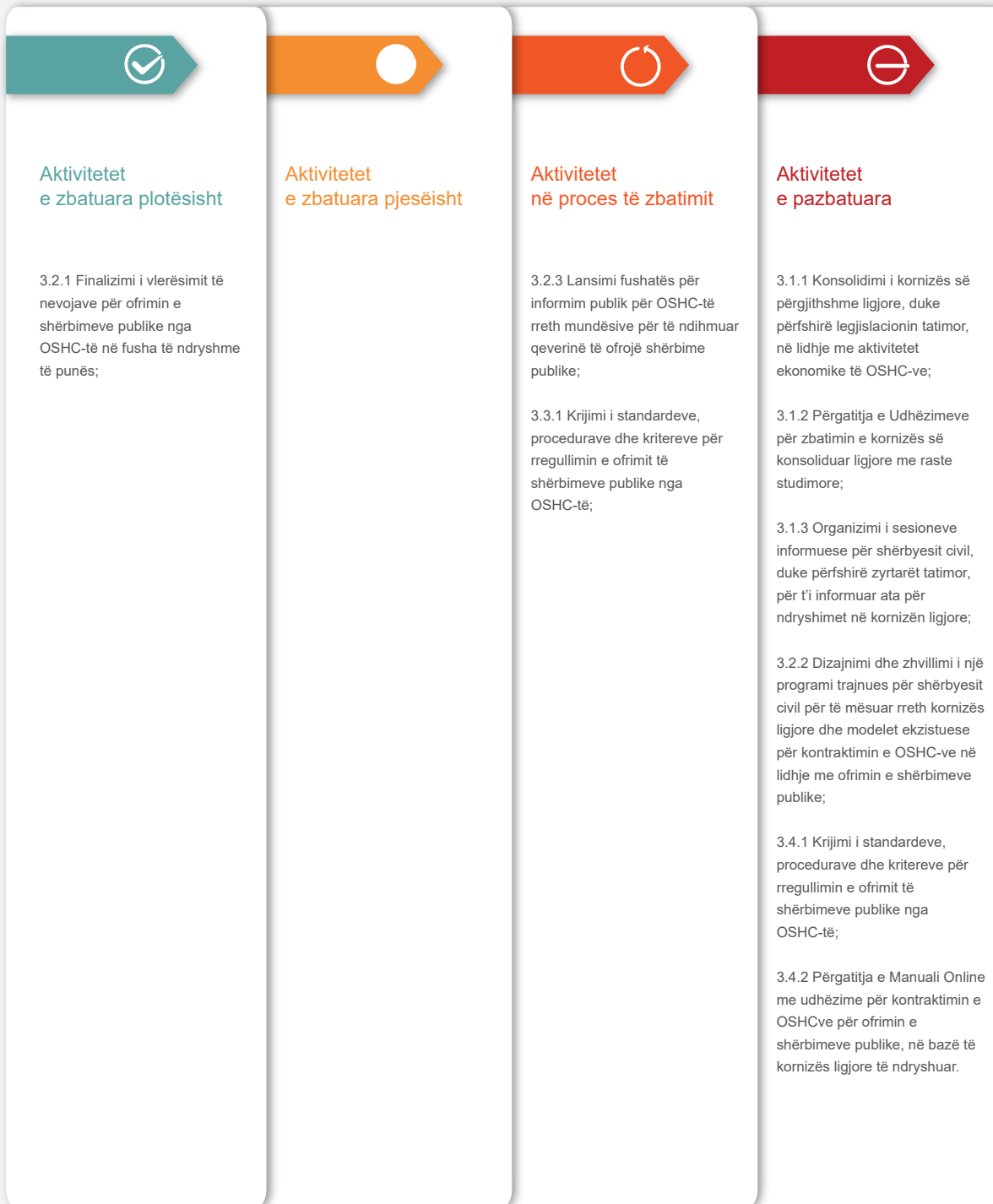
Infografika 5: Zbatimi i aktiviteteve në kuadër të Objektivit 3