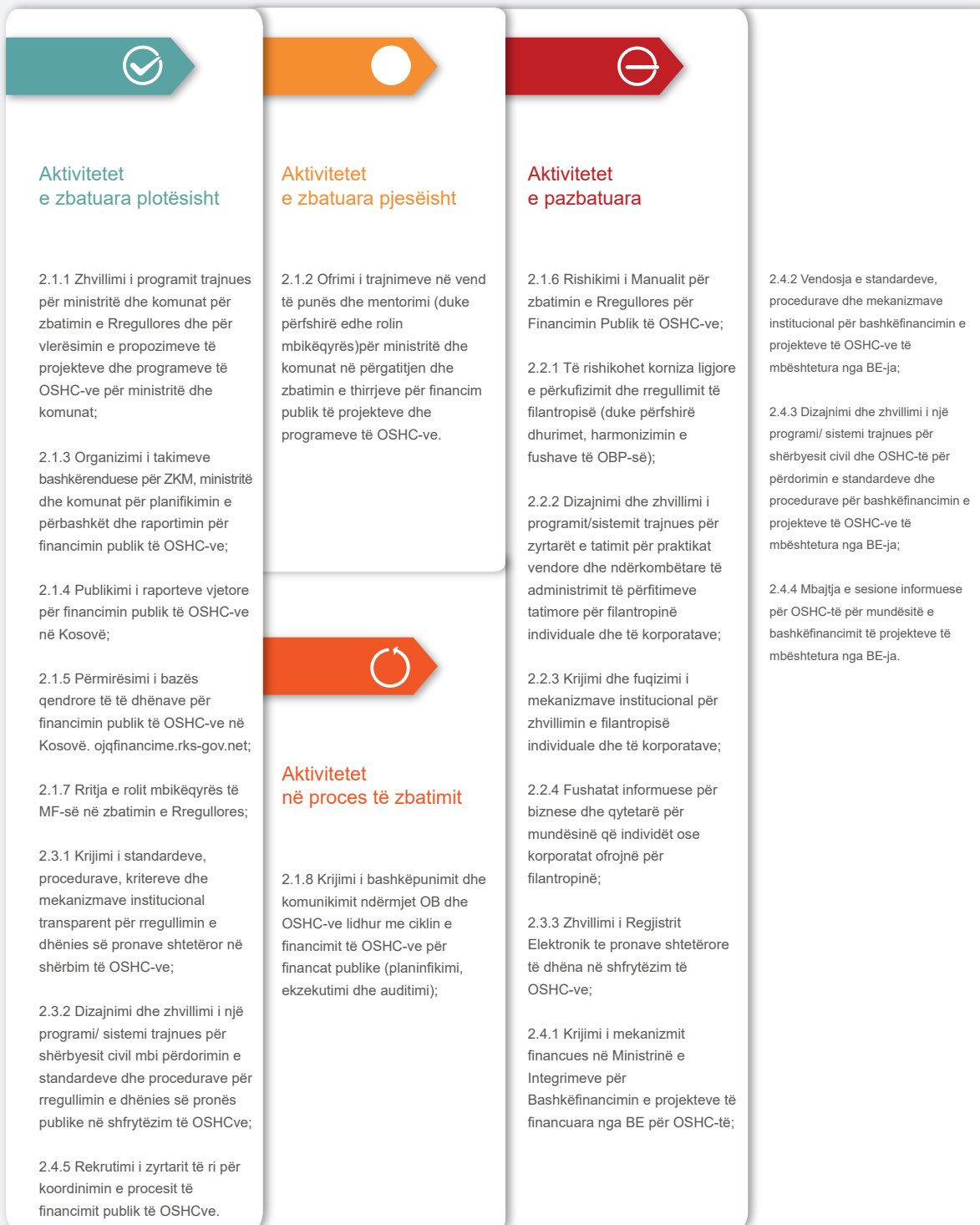
Infografika 4: Zbatimi i i aktiviteteve në kuadër të Objektivit 2