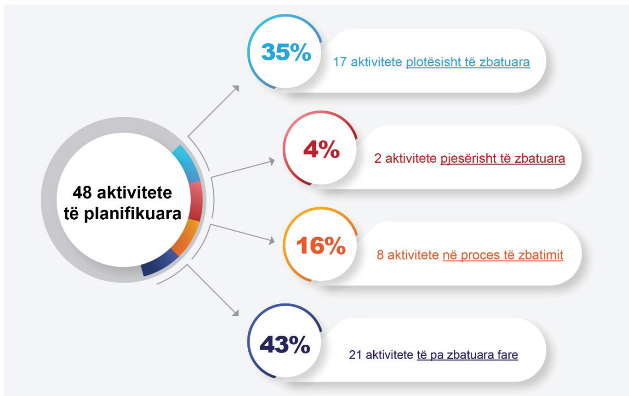
Infografika 1: Progresi i zbatimit të Strategjisë

Po ashtu, gjatë vitit 2022 KCSF së bashku me organizatën TOKA kanë filluar zhvillimin e një hulumtimi rreth vullnetarizmit në Kosovë, i cili ka për qëllim që të nxjerrë rekomandime dhe zgjidhje konkrete mbi përmirësimin e ekosistemit të vullnetarizmit në Kosovë. Aktivitetet tjera gjatë vitit 2022 të realizuara në kuadër të Strategjisë ishin kryesisht vazhdimësi e aktiviteteve të kaluara. Për detaje rreth progresit të zbatimit të Strategjisë deri në vitin 2022, shih infografikën e mëposhtme.