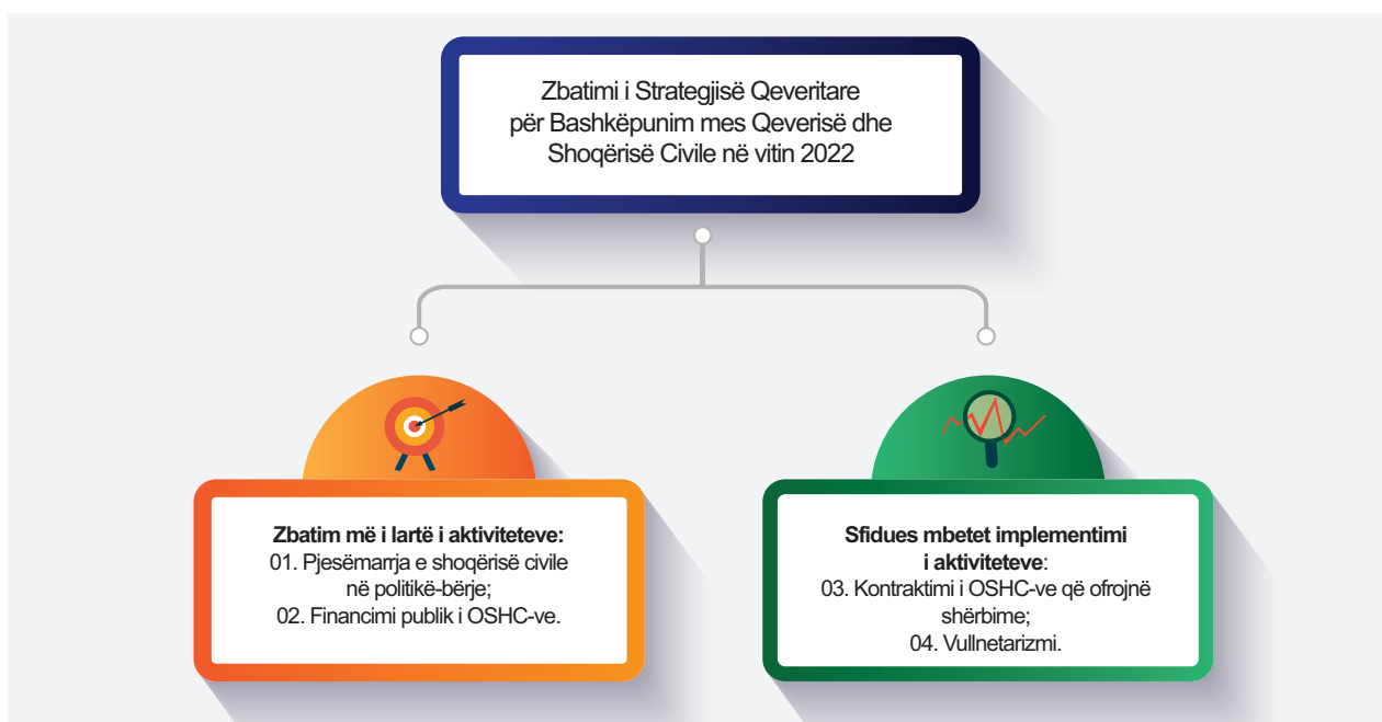
Infografika 2: Zbatimi i përgjithshëm i Strategjisë

Gjatë vitit 2022 janë ndërmarrë disa aktivitete nga ana e institucioneve përgjegjëse, duke ndikuar në progresin e zbatimit të objektivave të Strategjisë. Sa i përket nivelit të zbatueshmërisë së aktiviteteve të secilës prej objektivave, përveç objektivit 4 i cili nuk karakterizohet me asnjë aktivitet të zbatuar plotësisht, tri objektivat tjera tashmë karakterizohen me aktivitete të zbatuara plotësisht. Zhvillimi më i madh vërehet te objektivi 3, në kuadër të të cilit tek në vitin 2022 një aktivitet është arritur që të zbatohet plotësisht.