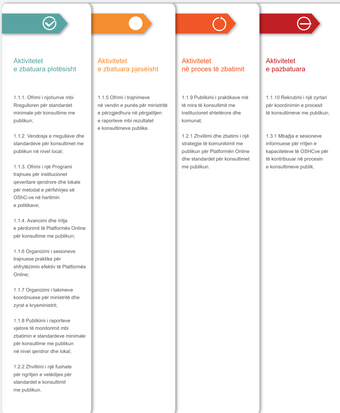
Infografika 3: Zbatimi i aktiviteteve në kuadër të Objektivit 1