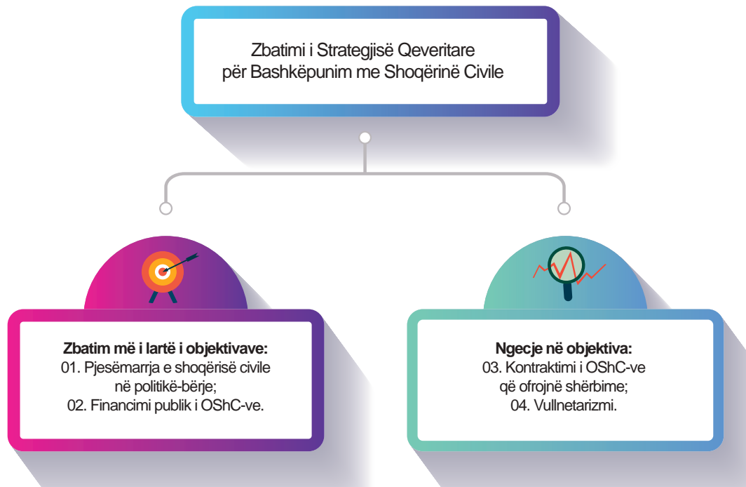
Infografika 3: Zbatimi i përgjithshëm i Strategjisë

Gjatë periudhës janar-qershor 2023 janë ndërmarrë disa aktivitete nga ana e institucioneve përgjegjëse, të cilat nuk është se kanë ndikuar shumë në nivelin e progresit të zbatimit të objektivave të Strategjisë. Niveli i përgjithshëm i zbatueshmërisë së objektivave të Strategjisë mbetet i njëjtë me atë të periudhës paraprake të raportimit, ku përveç objektivit 4 i cili nuk karakterizohet me asnjë aktivitet të zbatuar plotësisht, tri objektivat tjera karakterizohen me aktivitete të zbatuara plotësisht.