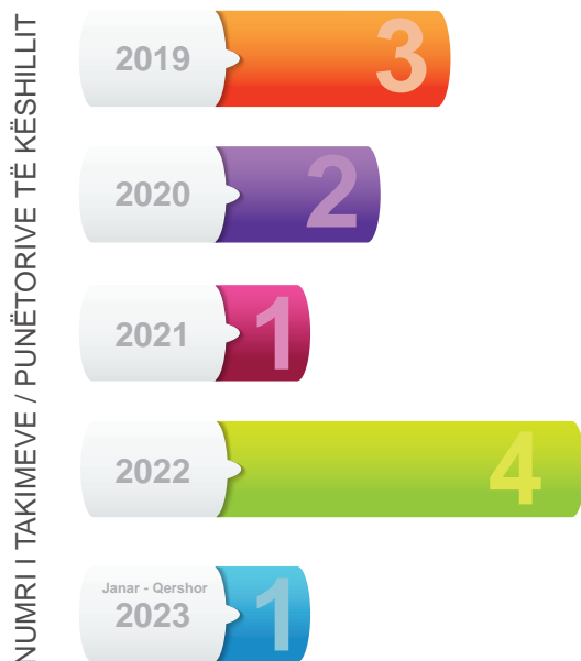
Infografika 9: Numri i takimeve/punëtorive të Këshillit

Gjatë muajit mars 2023 Këshilli ka mbajtur takimim e rregullt për të diskutuar rreth punës së Këshillit, zbatimit të Strategjisë dhe hapave të ardhshëm me qëllim që të mundësohet ndërmarrja e sa më shumë iniciativave për zbatim të aktiviteteve të Strategjisë deri në fund të skadimit të afatit të saj.