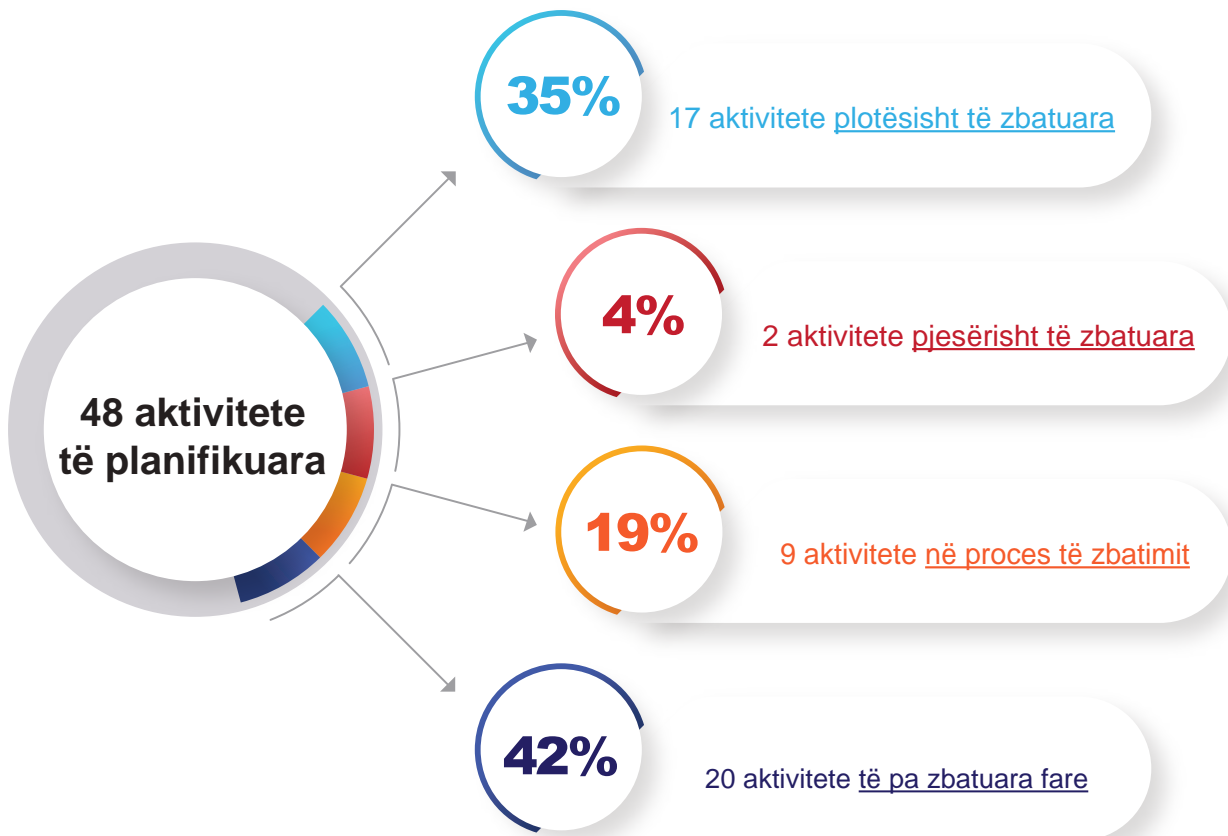
Infografika 1: Niveli i zbatimit të Strategjisë deri më 30 qershor 2023

Detajet tjera rreth progresit të zbatimit të Strategjisë deri në gjysmën e parë të vitit 2023 janë të paraqitura në infografikën e mëposhtme.