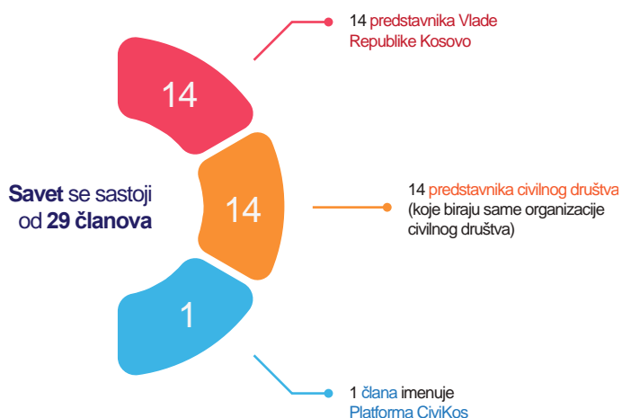
Infografika 8: Sastav Veća

Savet predstavlja glavni stalni savetodavni mehanizam koji koordinira celokupni proces saradnje vlasti sa civilnim društvom. Svrha Saveta je jačanje saradnje Vlade sa civilnim društvom, promocija i podrška jačanju sektora civilnog društva i obezbeđivanje koordinacije i monitorisanja sprovođenja Vlade strategije za saradnju sa civilnim društvom 2019-2023.