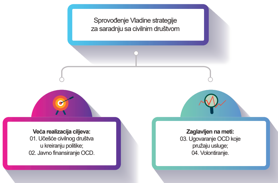
Infografika 3: Opšte sprovođenje Strategije

U periodu januar-jun 2023. godine preduzeto je nekoliko aktivnosti od strane nadležnih institucija, koje nisu imale veći uticaj na stepen napretka u sprovođenju ciljeva Strategije. Opšti nivo primjenjivosti ciljeva Strategije ostaje isti kao i iz prethodnog izveštajnog perioda, pri čemu osim cilja 4 koji ne karakteriše nijedna potpuno sprovedena aktivnost, ostala tri cilja se karakterišu sa potpuno realizovanim aktivnostima.