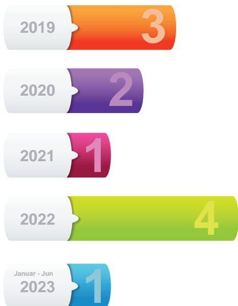
Infografika 9: Broj sastanaka/radionica Veća

Savet je tokom meseca marta 2023. god. održao redovnu sednicu na kojoj se raspravljalo o radu Saveta, sprovođenju Strategije i narednim koracima kako bi se omogućilo što više inicijativa za sprovođenje aktivnosti Strategije do kraja njenog roka.